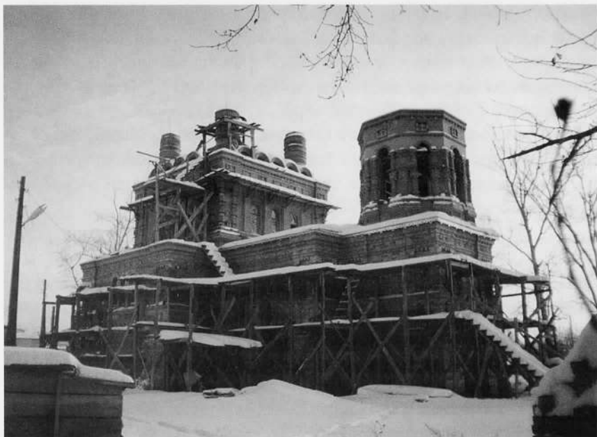
Этап восстановления православной церкви Святого Николая Чудотворца в Кулаково. 2002 год.