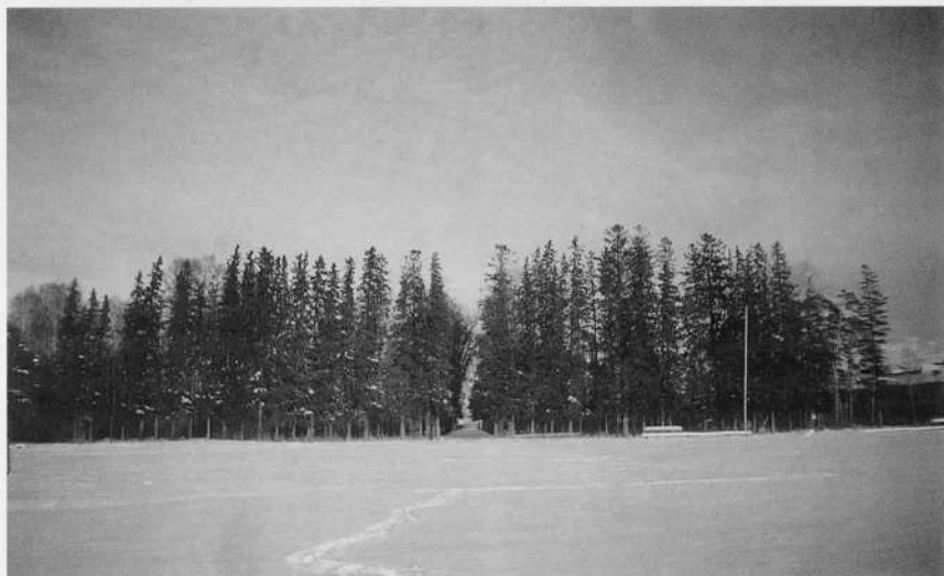
Чукмалдинский сад в Кулаково. Современный вид.