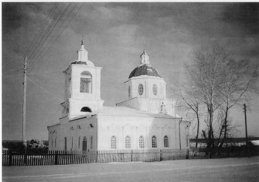
Православная церковь Покрова Пресвятой Богородицы в Каменке. 2002 год.

Церковь-то нашу видел? Покровская. Недавно отремонтировали. Правда, колоколов ещё нету. Ну да ладно, и без того хлопот много было. В ней долгое время склад был, в одном из приделов цемент хранили, а он, видать, сырости в себя набрал и как камень сделался. Долго же, когда до церкви руки, наконец, дошли, его отскабливали. Повозились мужички с ним. Теперь церковь – всем на радость, как в былые времена. Загляденье просто. Спасибо добрым людям. Вот бы дожить до того дня, когда колокола поставят. Всё мечтаю хотя бы перед смертью колокольный звон послушать.